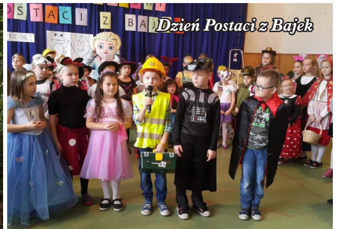
Dzień Postaci z Bajek