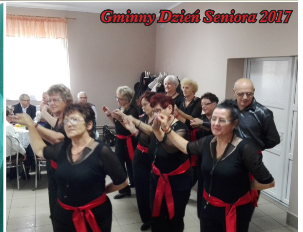
Gminny Dzień Seniora 2017