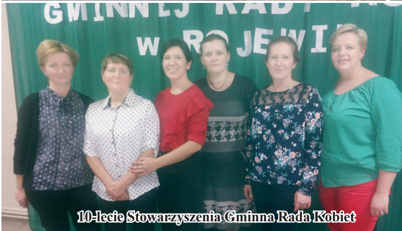
10-lecie Stowarzyszenia Gminna Rada Kobiet