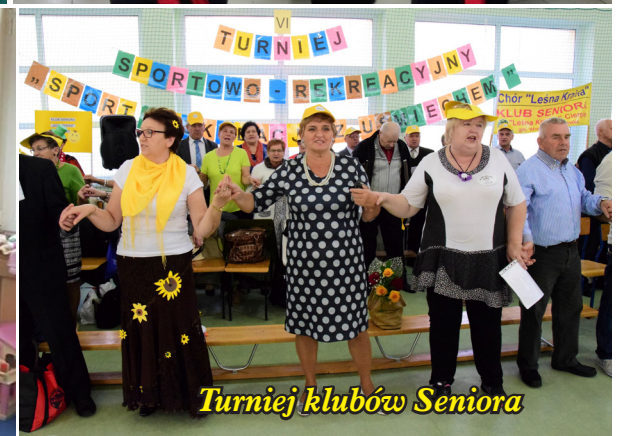
Turniej klubów Seniora