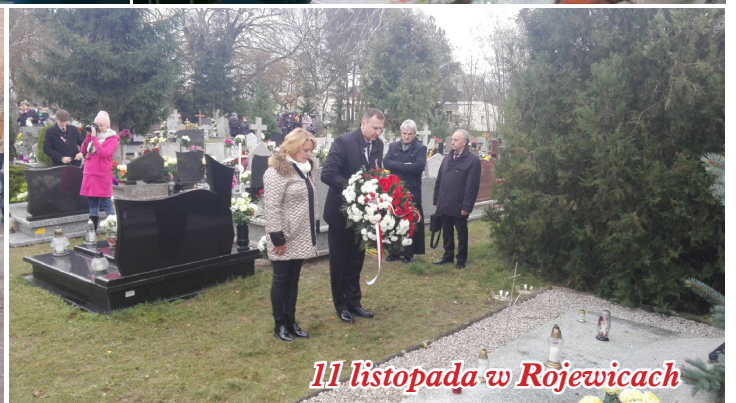
11 listopada w Rojewicach