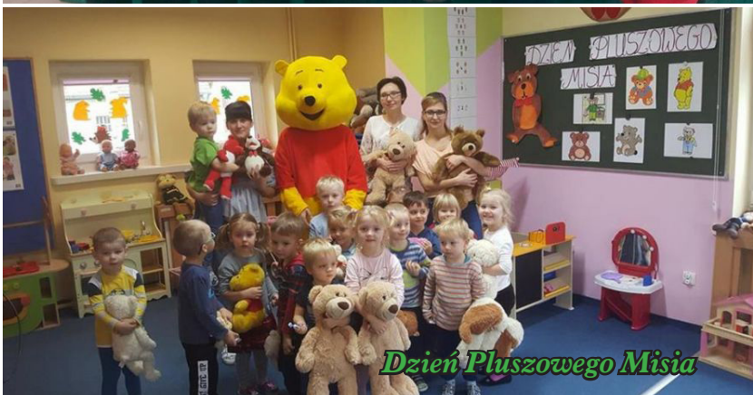
Dzień Pluszowego Misia