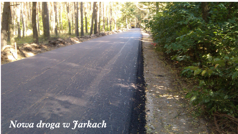
Nowa droga w Jarkach