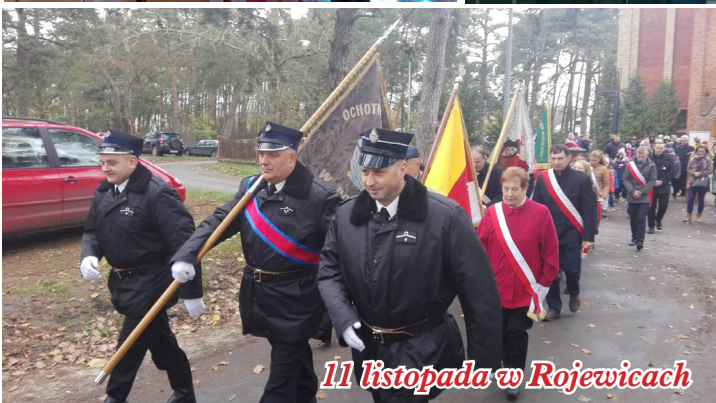
11 listopada w Rojewicach