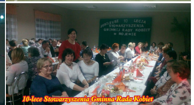
10-lecie Stowarzyszenia Gminna Rada Kobiet