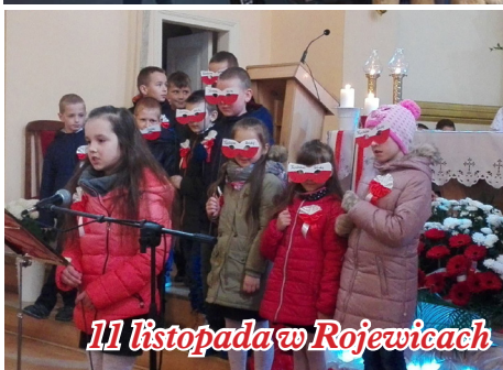
11 listopada w Rojewicach