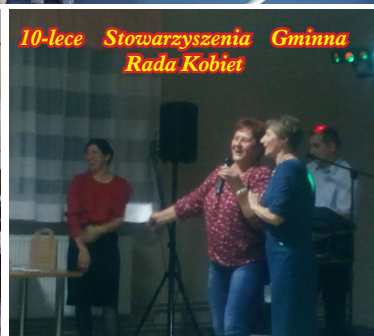
10-lecie Stowarzyszenia Gminna Rada Kobiet